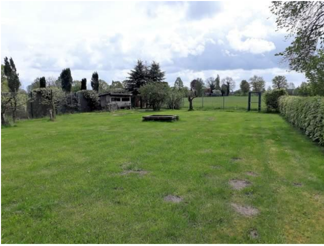
Garten mit Weitblick ins Grüne