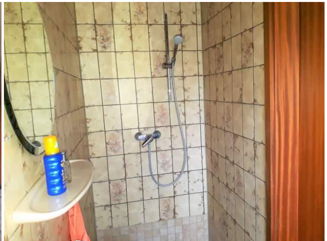
Duschbad im Erdgeschoss